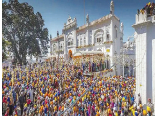
● लुधियाना से भी संगत पहुंची होला मोहल्ला।

लुधियाना/यूटर्न/19 मार्च। रंगों के त्यौहार होली के पावन अवसर पर रात में धार्मिक परंपरा के अनुसार रात में होलिका दहन के बाद शुक्रवार तड़के से ही दिनभर महानगर समेत तमाम जगह अबीर-गुलाल खेला गया। दूसरी ओर खालसा पंथ की स्थापना को समर्पित पावन-पर्व होला मोहल्ला में होली से अगले दिन शामिल होने के लिए संगत शनिवार सुबह तक श्री आनंदपुर साहिब रवाना होती रही। दूसरी ओर, शुक्रवार के पाक-दिन मुस्लिम समाज ने शबे-बरात के मौके पर रात भर इबादत की, शनिवार की सुबह तक जिलेभर में भी मस्जिदों-घरों में इबादत के चलते रौनक रही।