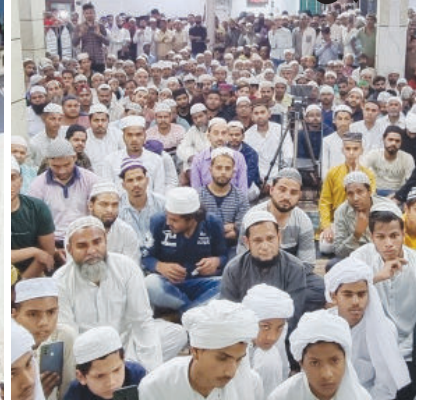
शबे-बरात : मस्जिदों में इबादत से गुलजार।